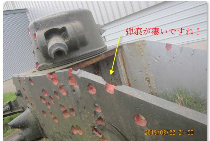
これは館外に置いてあったイギリスのマチルダ (MATILDA) 1 (A11) 戦車の残骸。1939年から1940年にかけて139台が製造されたが、そのうちの97台はドイツがフランスに侵攻してくる時に破壊されたと説明書きには記載されていた。