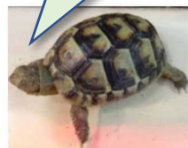
Tortoise (トータス) 陸亀