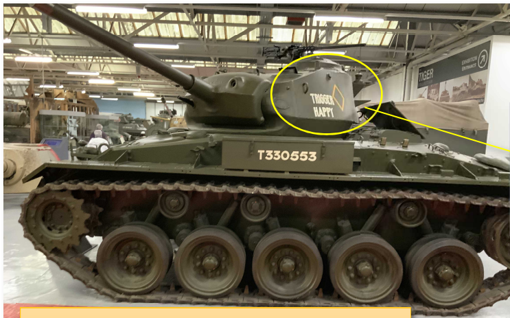
米国の M24 軽戦車。1944 年から生産。