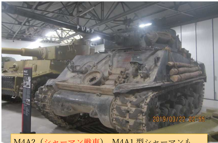
M4A2 (チャーマン戦車)。M4A1 型チャーマンも戦車博物館内写真④で紹介したが、その次の世代の戦車。