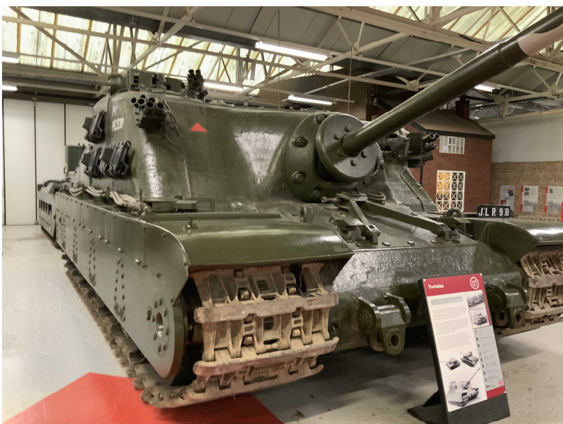
第2次大戦末期に6台しか生産されなかった英国の重戦車 Tortoise (A39)

tortoise は亀だが、何でも陸亀 (つまりワシのこと) で turtle は海亀のことを指すらしい。知ってたって、こりゃ失礼。