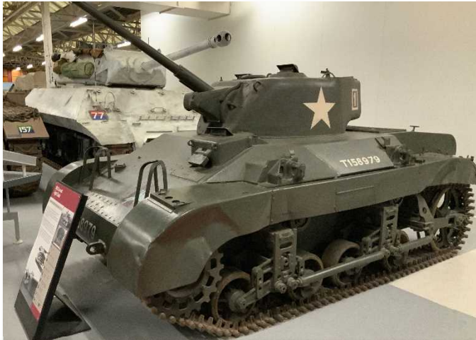
M22 Locust Light Tank 米国で1942年より生産。Light Tankは軽戦車。C54などの輸送機で運ぶことが出来た (airpotable in the C54) と説明書きには書いてある。