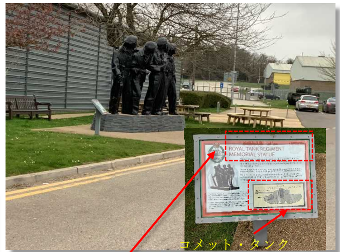
コメット・タンク

入り口の前には遊具道具もあって子供達も沢山来ていました。日本では一寸考えられないですけど。