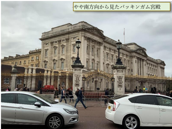
やや南方向から見たバッキンガム宮殿

バッキンガム宮殿はトラファルガー広場の約1km 南西方向にある。トラファルガー広場からも道があるので歩いて行ける。その途中にはグリーンパークがあり、グリーンパークの北には日本大使館がある。