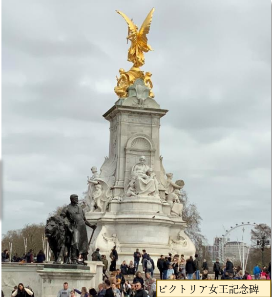
ビクトリア女王記念碑

ビクトリア女王記念碑は1911年に建設されている。バッキンガム宮殿の正面に建っているが、右写真は後ろから背中を写しているの、正面から見た人はネットで見てください！