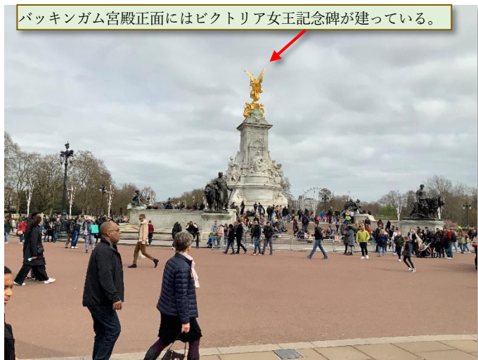
バッキンガム宮殿正面にはビクトリア女王記念碑が建っている。

バッキンガム宮殿はバッキンガム公であるジョン・シェフィールドが私邸として1703年に建てた。1837年にビクトリア女王がここに移り住んで移行はイギリス王室の公式宮殿となっている。