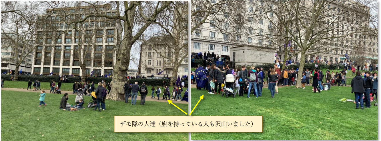
デモ隊の人達 (旗を持っている人も沢山いました)

バッキンガム宮殿を見学するのに近くのグリーンパーク付近の地下鉄で降りたら、何と！EU 離脱反対のデモ隊の集合場所の一つだったようで、もみくちゃとなり、やっとこの場所に出るのに 20 分くらいかかりました。建物の前がピカデリー通りになります。トラファルガー広場にもつながっていますが、この時のデモ人数は 100 万人程度だったとのこと。日本でも報道されたようですね。おかげで良い思い出が出来ました。その他、ロンドンハーフマラソンも見ることが出来て短い間の旅行でしたが、凝縮されて楽しかったです。