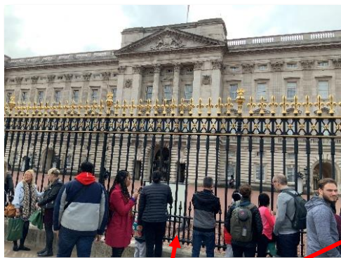
バッキンガム宮殿