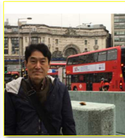
上写真はロンドン市内。後ろに見えるのは2階建てバス。