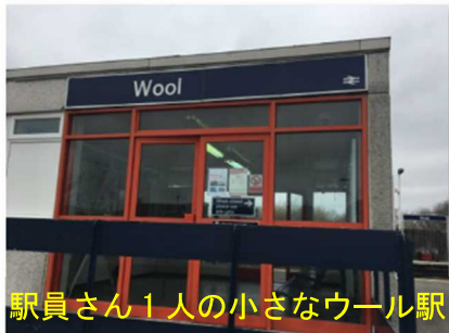
駅員さん 1 人の小さなウール駅

Waterloo は歴史で習ったワテルローの戦いとも関連する。waterloo はワテルローと読めますよね。