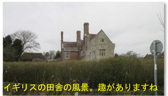
イギリスの田舎の風景。趣がありますね

ウール駅からボービントンの戦車博物館まで約 4 km なのでタクシー利用でも良かったのですが、歩いて行きました。イギリス国旗のある民家を通ったり、窓際にいた猫から「どこから来た外国人か?」といった表情で見つめられたりしました。