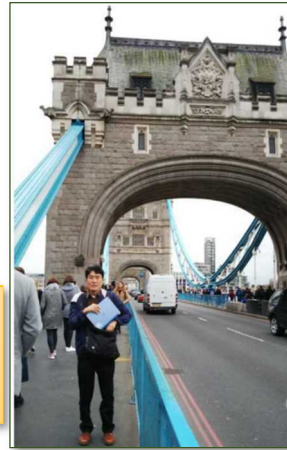
上写真もロンドン市内 ロンドン・ブリッジ