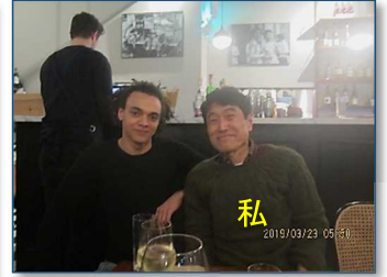
ロンドンの料理店で一寸親しく会話をした英国人とのツーショット写真