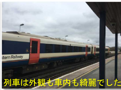
列車は外観も車内も綺麗でした