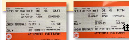
往復切符を買いました