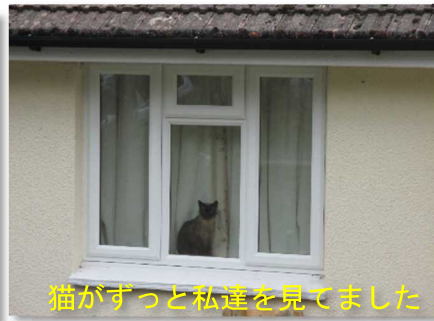
猫がずっと私達を見てました