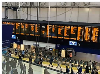
左の 2 枚の写真はロンドンの大きなウォータールー (Waterloo) 駅。朝のラッシュに重なって大混雑!