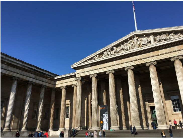
大英博物館 (The British Museum) 正面