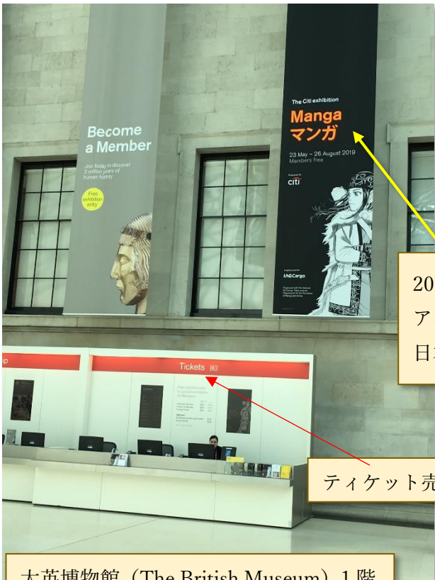
2019年5月23～8月25日迄マンガ展が開かれる案内。アニメでなく Manga マンガと書かれているところが日本アニメの浸透を表現しているようで興味深いですね。