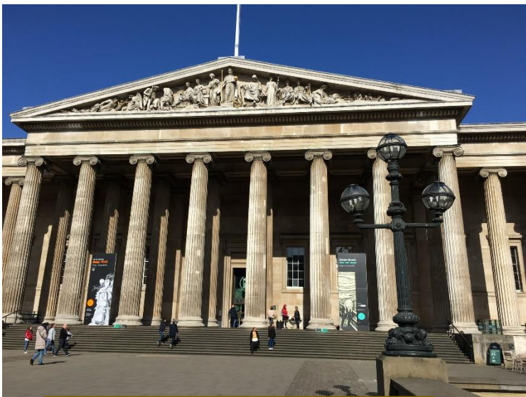
大英博物館 (The British Museum) 正面

やっぱり本場イギリスでこそローバーはじっくりきますね！あ、日本の風景にそぐわないという事ではありません。ローバーの形は好きで昔は良くプラモデルを作っていました。今も私の医師室にはローバーのフィギュアを飾っています。