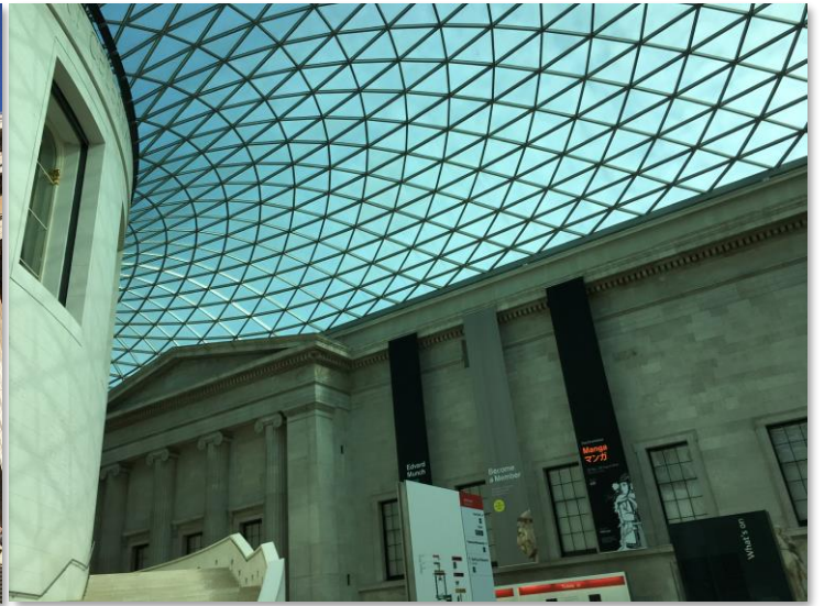
1階フロア。屋根が綺麗！