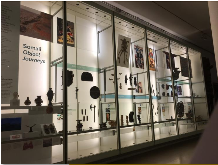
1階展示室。アフリカなどの紹介をしていました。