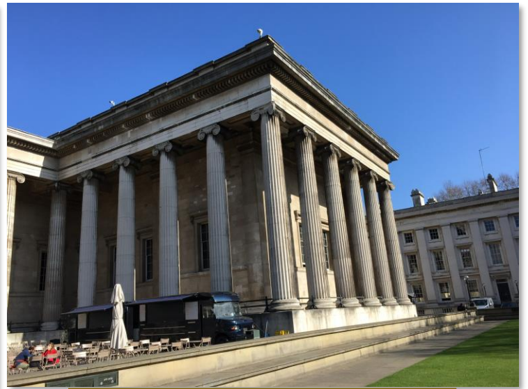
大英博物館 (The British Museum) 右側

大英博物館 (The British Museum) は1759年に開館しています。当日は残念ながら1階以外は展示物などの整理などが行われていたようで、見る事が出来ませんでした。残念！